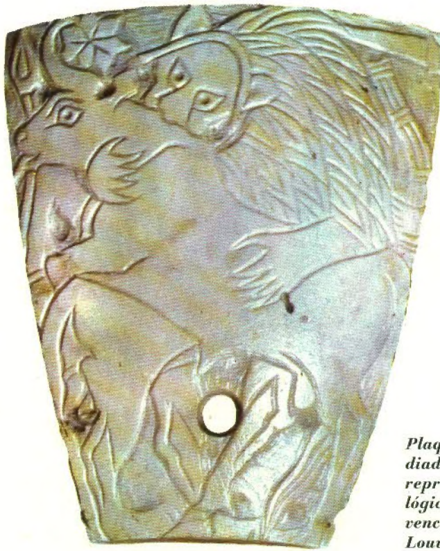
Plaqueta de concha de mediados del III milenio que representa una escena mitológica en que un león ataca y vence a un toro (Museo del Louvre, París).

Mientras los egipcios, sobre todo los devotos de Ra, investigaban las relaciones de los números y descubrían maneras de